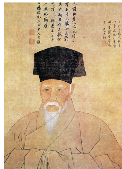
Илл. 3. Шэнь Чжоу. Автопортрет в возрасте 80 лет. (XVI век).

Китайский пейзаж и портретная живопись сравнимы с западными аналогами, хотя китайские художники, рисовавшие пейзаж, не следовали правилу перспективы в такой степени, как это делали их западные коллеги [3].