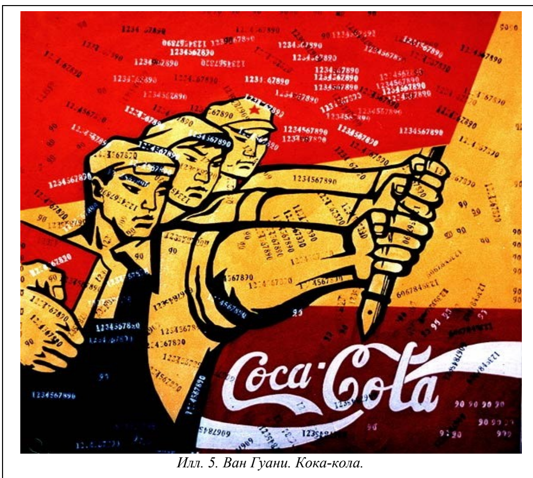
Илл. 5. Ван Гуани. Кока-кола.

Тридцать лет назад можно было купить первоклассную китайскую живопись, созданную примерно в 1950-х гг., за 20–30 RMB. Сегодня такая живопись оценивается минимум в 1000 раз больше, а некоторые работы выросли в цене в 100 тысяч раз.