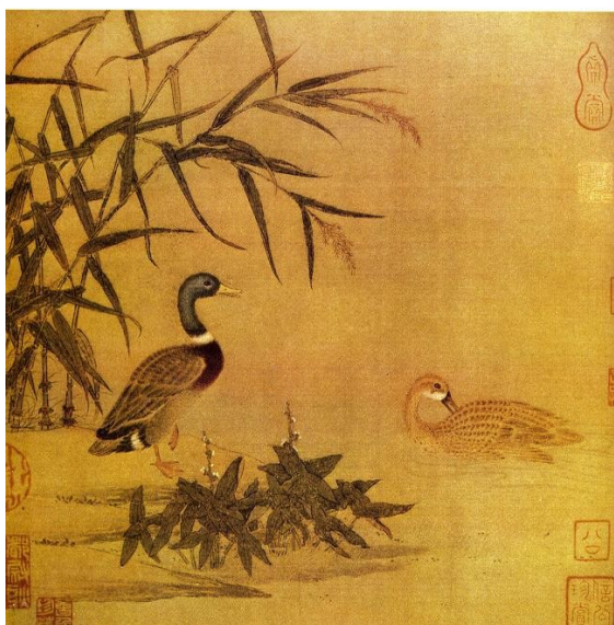
Илл. 2. Хуан Цюань (приписывается). Дикае утки в камышах. Альбомный лист. X век

Пейзажная живопись, естественно, не исчерпывает всего многообразия видов и жанров средневекового китайского искусства.