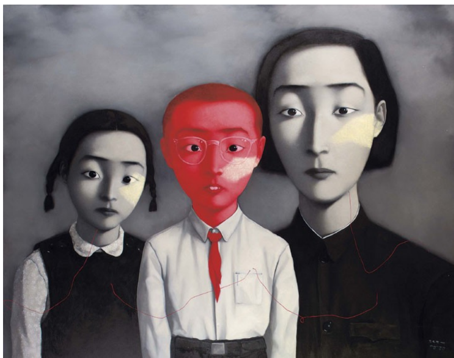
б. Чжан Сяоган. Большая семья.

На границе с Гонконгом, в маленьком городке Буцзи (Buji) расположена так называемая «деревня живописи» – Дафен (Dafen). Именно здесь искусство превращено в