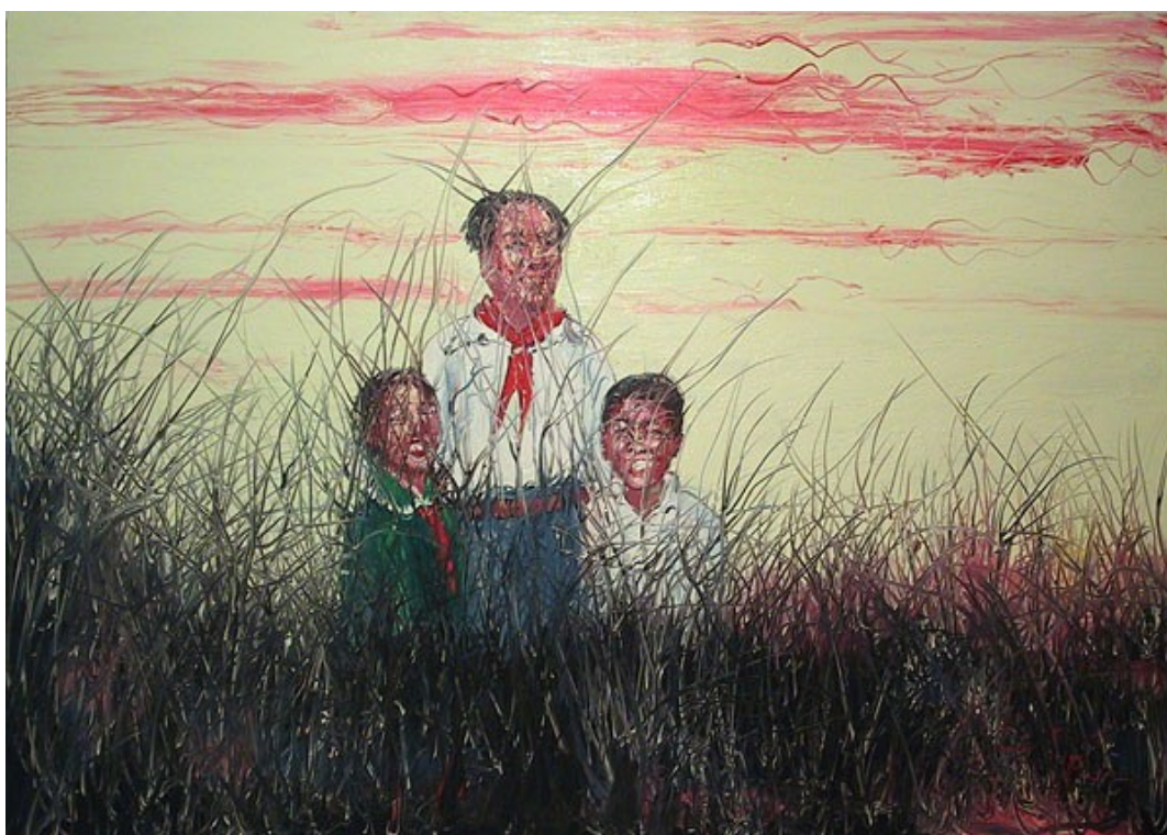
Илл. 7. Цзэн Фаньчжи. Мао с нами.

«Рынок упадет, по крайней мере, на 50% за 2009 год. Кризис привел к уменьшению количества посетителей в галереях, да и цены из-за финансового пузыря были слишком высокими. Мы все знали, что ажиотаж рано или поздно закончится, но не ожидали, что это произойдет именно сейчас», – комментирует ситуацию ветеран рынка современного искусства с восемнадцатилетним стажем, владелец галереи «Красные ворота» в Пекине