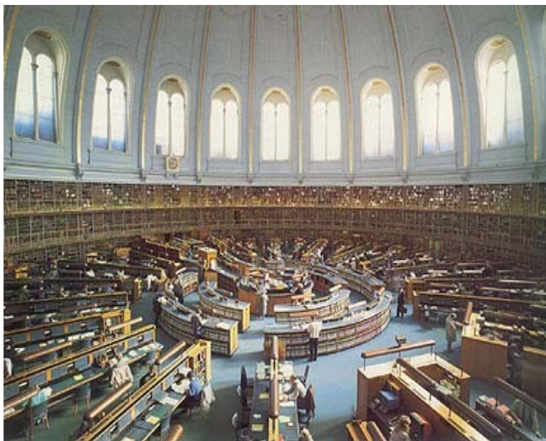
Илл. 3. Читальный зал Библиотеки Британского музея

рассчитан на август 2007 – март 2009 года. Бюджет программы составил 3,7 млн фунтов стерлингов (4,5 млн евро) [6]. Программа осуществлялась при поддержке 146 координаторов, работающих на местах по всей стране. Она была разработана Департаментом по делам детства, школы и семьи в британском правительстве. Ее реализация легла на плечи двух независимых ассоциаций – National Literacy Agency и Reading Agency, которые уже много лет работают в области пропаганды книги и чтения, проводят кампании по борьбе за новых читателей как на национальном, так и на местном уровнях. Деятельность этих двух ассоциаций заслуживает особого внимания, поскольку позволяет понять, как осуществляется на практике культурная политика в области чтения в Великобритании.