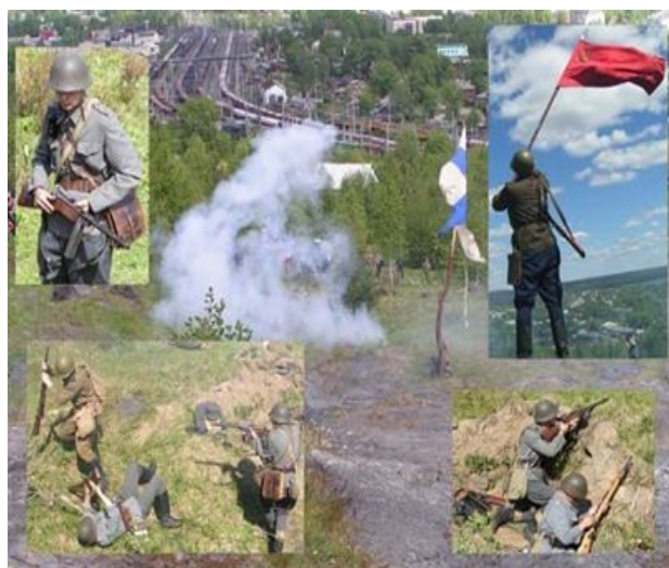
Ил. 8. Реконструкции военно-исторических клубов

Поисковое движение и в будущем, к сожалению, ждет немало работы. События последних лет в России показали, что войны не закончились в 1945 году. Итоги боев в Чечне, а ранее в Афганистане показывают, что количество пропавших без вести солдат в условиях современной войны значительно возрастает среди общих потерь российской армии. Это означает, что близкие вновь будут тратить годы жизни на выяснение судьбы солдата, либо попросят об этом энтузиастов-поисковиков. Пока будут существовать войны и их страшные последствия, будет существовать и поисковое движение.