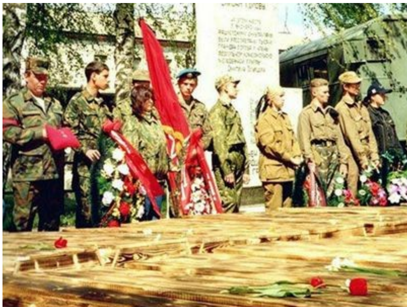
Ил. 4. Торжественное перезахоронение (г. Сычевка 06.05.2000).

Однако основные цели поискового движения – это не только сохранение и увековечение