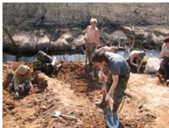
Ил. 5. "Так работают поисковики"