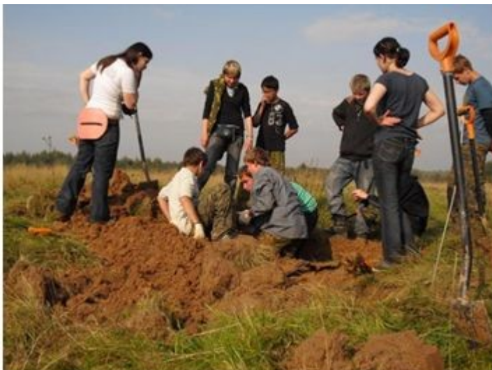
Ил. 7. Социально-реабилитационный центр "Отрадное"

Социально-реабилитационный центр «Отрадное». Участие во «Всероссийской «Вахте Памяти - 2009» поисковых объединений Российской Федерации, посвященной 64-ой годовщине Победы в Великой Отечественной войне 1941-1945 гг.