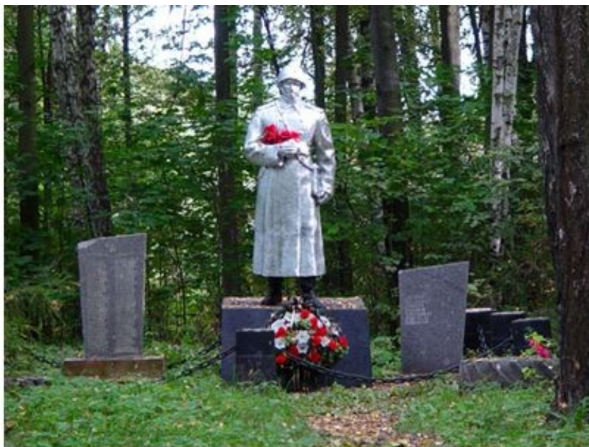
Ил. 2. Братская могила, д. Ботово, Волоколамский р-н Московской обл.