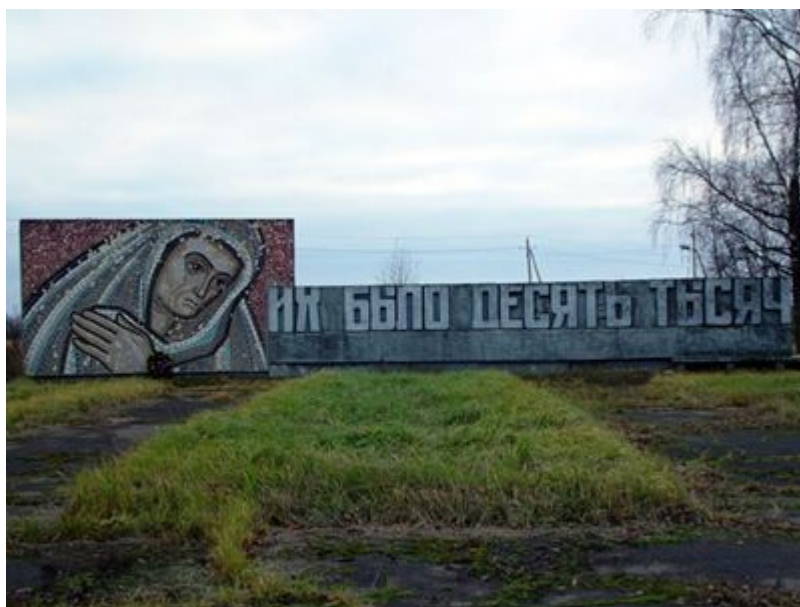
Ил. 3. Мемориал на Минском шоссе

Как часто мы задаемся вопросом, а сколько их, действительно, не захороненных? Сколько семей до сих пор еще не получили никаких сведений о без вести пропавших мужьях, отцах, дочерях, дедах?! Много ли известно о том, сколько на местах бывших сражений лежит еще не захороненных останков павших воинов. По одним данным это сотни тысяч, по другим – не один миллион. Их ищут тысячи соотечественников, а еще больше уже и не ищут.