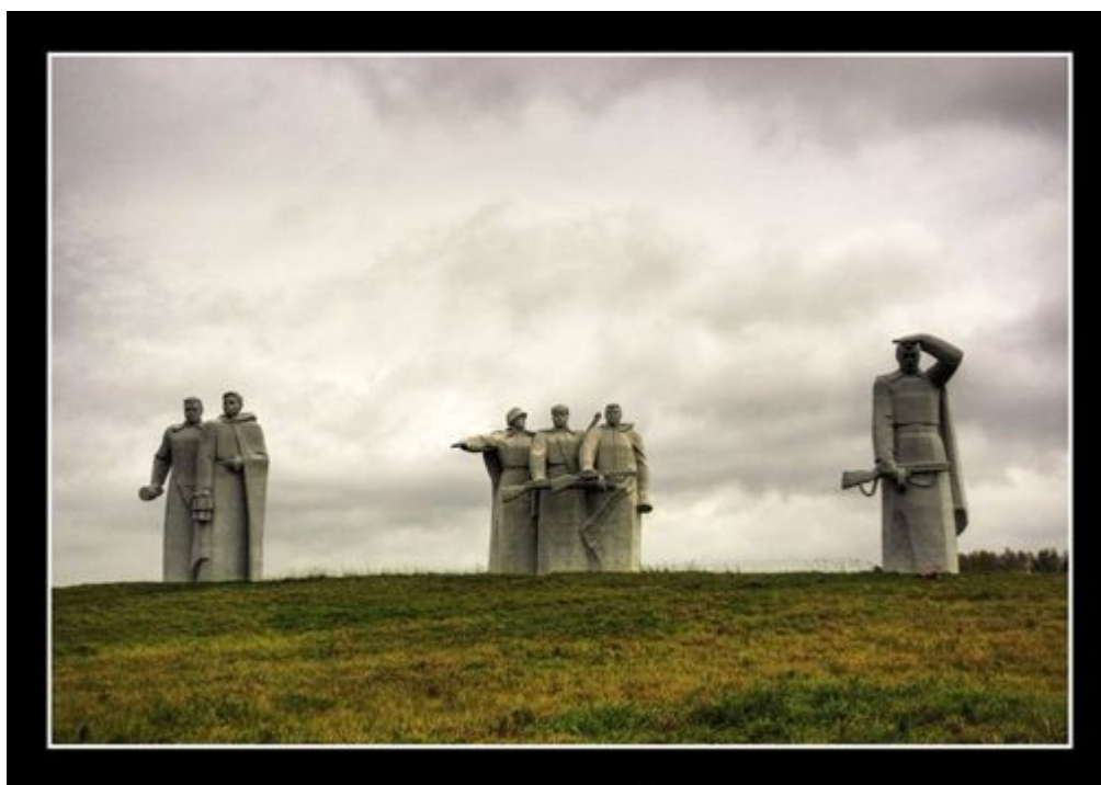
Ил. 1. Мемориал Дубосеково

Первым переломным моментом в Великой Отечественной и Второй мировой войне стала легендарная битва под Москвой. Подмосковная земля помнит события того великого и страшного сражения. Здесь находится более двух тысяч памятников воинской славы. Это 11 крупных мемориальных комплексов общероссийского значения: обелиски на братских могилах, военная техника, установленная в местах прошедших боев, мемориальные стелы. К 60-летию Победы в Великой Отечественной войне отреставрированы монумент на месте контрудара советских войск на Перемиловской высоте в Яхроме, мемориал на рубеже обороны у разъезда Дубосеково, памятник на братской могиле Героев-панфиловцев у деревни Нелидово Волоколамского района, мемориальный комплекс на месте казни Зои Космодемьянской в деревне Петрищево Рузского района, памятник Герою Советского Союза Виктору Талалихину в Подольском районе, монумент «Их было 10 тысяч» на 141-м км Минского шоссе.