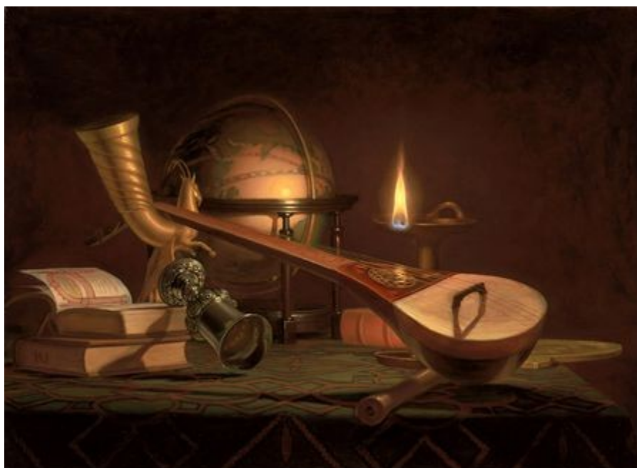
Ил. 3. Хейманс Ральф. "Натюрморт"

Натюрморт Ральфа Хейманса показывает декларативную тоску известных слоёв западной интеллигенции, их формальную культурную ориентацию на эпоху Возрождения, – хотя на деле «ретро-посыл», «духовная интенция» подобных произведений ближе всего не к Возрождению, «классическому» средневековью.