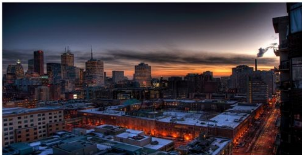
Ил. 1. Рознер Доминик. "Городской пейзаж"

Всеобщая ненависть к рекламе (имиджу вместо сути) – марка нашей эпохи. Об этом уже много лет пишут публицисты и юмористы, об этом снимаются фильмы (от стремлян «Квартиры» с Джеком Леммоном и Ширли Маклейн), об этом сегодня пишут авантюрные романы 1 . Все и всюду понимают, что агрессия в навязывании любой продукции – явление опасное, форма духовной коррупции, но поделать с этим якобы ничего нельзя... Почему?