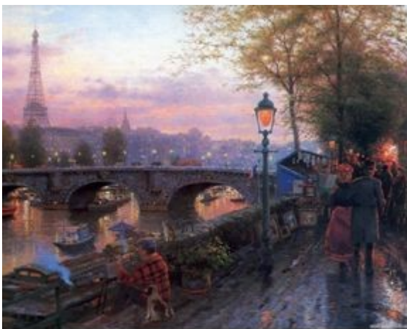
Илл. 5. Кинкейд Томас. «Париж»

мужчин, открывающих женщинам двери, помогающих на лестнице и т.п. Можно еще подавать на них в суд по обвинению в «сексизме», уж это наверняка поможет борьбе за равноправие! Девиантное поведение выдает спекулянтов сразу, с головой, а вот как быть с «массами», продолжающими демонстрировать «невыносимо дурной вкус»? Дело не в их любви к произведениям Томаса Кинкейда, «мастера света», ненавистного интеллектуалам, не в безвкусице обстановки их жилищ и не в привычке к прослушиванию инструментальных хитов Кенни Джи, полагают авторы монографии. «Хороший вкус» вполне социален, и диссертация Николая Чернышевского, малоизвестная в США, воспроизводится в книге другими словами, анонимно, – коротко, но емко. «Хороший вкус – это позиционное благо. <...> Любой потребитель, покупающий некий объект для выражения своего стиля и вкуса, неизбежно участвует в конкурентном потреблении. <...> Конформизм и проведение различий всегда идут рука об руку – человек послушно следует установкам эксклюзивного клуба, чтобы отличаться от черни» [с. 151–153].