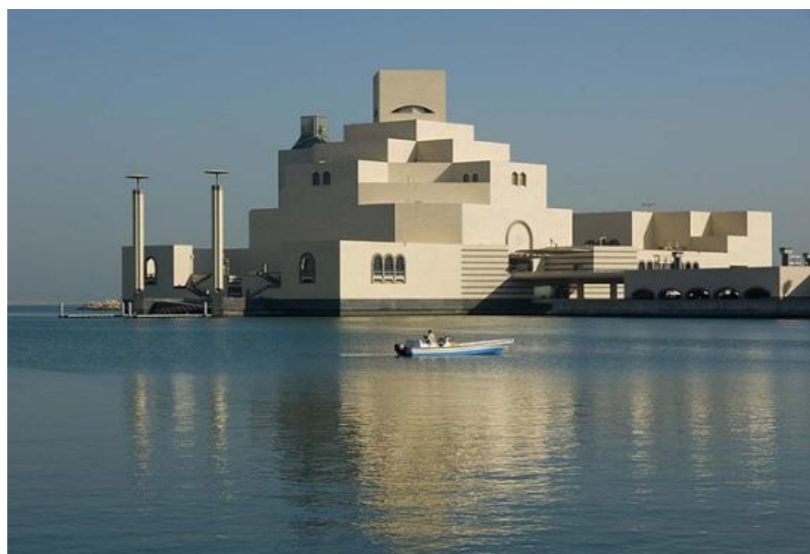
Музей Исламского искусства. Вид со стороны Персидского залива

Последние десять лет город Доха, столица Катара, представляет собой гигантскую и невероятно слаженную ударную стройку с отдельными прекрасно отстроенными и обжитыми зонами. Здесь повсюду видишь небоскребы, которые тянутся вверх – в будущее страны. Основные объекты строительства – это многоэтажные пятизвездочные отели, конгресс–холлы, бизнес–центры, а также крупные спортивные сооружения. Здесь созданы благоприятные условия для ведения бизнеса, отдыха, организации гонок на яхтах, проведения бегов верблюдов. Но с исторической, культурной составляющей в Дохе дела обстояли несколько напряженно. Кардинально изменить ситуацию решили эмир Катара и его 26-летняя красавица дочь по имени Шейха аль-Маясса [1].