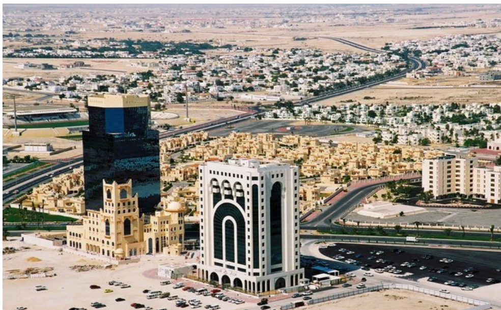
Столица Катара – Доха

Последние десять лет город Доха, столица Катара, представляет собой гигантскую и невероятно слаженную ударную стройку с отдельными прекрасно отстроенными и обжитыми зонами. Здесь повсюду видишь небоскребы, которые тянутся вверх – в будущее страны. Основные объекты строительства – это многоэтажные пятизвездочные отели, конгресс–холлы, бизнес–центры, а также крупные спортивные сооружения. Здесь созданы благоприятные условия для ведения бизнеса, отдыха, организации гонок на яхтах, проведения бегов верблюдов. Но с исторической, культурной составляющей в Дохе дела обстояли несколько напряженно. Кардинально изменить ситуацию решили эмир Катара и его 26-летняя красавица дочь по имени Шейха аль-Маясса [1].