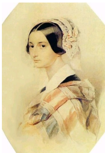
Александра Осиповна Смирнова-Россет (1809 – 1882 гг.). Акварель П. Соколова

Рисунок Э. Эстеррейха (1820 г.) с дарственной надписью Пушкину