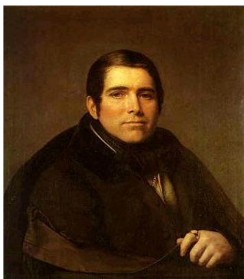
Петр Александрович Плетнев (1761–1866 гг.)

Для понимания заграничного периода жизни Гоголя необходимо сделать