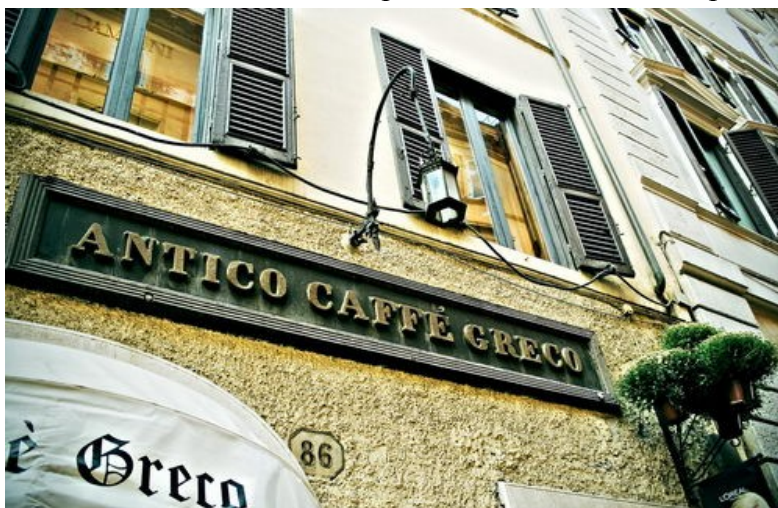
Кафе "Греко", г. Рим (Италия).

В Риме русские художники и литераторы любили собираться недалеко от площади Испании на улице Кондотти в старинном кафе Греко. В наши дни при входе в это кафе висит мемориальная доска со словами «Старинное кафе Греко, основано в 1760 году. Взято под охрану государства, как ценный памятник старины». Добавим, не просто ценный памятник старины, а своего рода интернациональный клуб искусств – место встреч и времяпрепровождения знаменитых писателей, художников и композиторов. Тут сживали Гёте, Байрон, Стендаль, Шелли, Андерсен, Бизе, Гуно, Мицкевич, Россини, Берлиоз, Мендельсон, Лист, Вагнер, Тосканини... Гоголь был завсегдатаем знаменитого кафе. В глубине кафе на стене, среди других, можно увидеть миниатюрный портрет Н.В. Гоголя, а чуть далее под стеклом лист бумаги со строками из письма Плетнёву от 17 марта 1842 г.: «О России я могу писать только в Риме, только там она предстает мне вся во всей своей громаде» [4, с. 332].