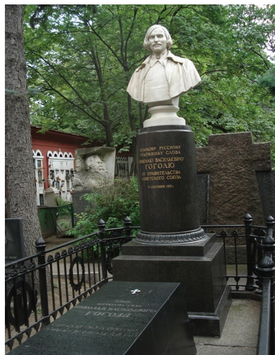
Памятник на могиле Н.В. Гоголя Новодевичье кладбище, г. Москва