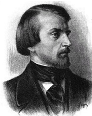
Виссарион Григорьевич Белинский (1811–1848 гг.)

Как уже бывало прежде, на смену плодотворному и деятельному периоду неизбежно приходит депрессия, по времени совпавшая с переосмыслением «Мертвых душ» и изданием «Выбранных мест из переписки с друзьями». Сразу после опубликования в 1847 г. на эту книгу обрушился шквал критики. Особенно резок был В.Г. Белинский: высшая степень его негодования, вызванного «Выбранными местами», выразилась в известном письме критика из Зальцбрунна. Удар чувствовался особенно остро, поскольку незадолго до этого Белинский дал хвалебную рецензию на «Мертвые души»; он писал о «беспримерной в нашей литературе оригинальности и самобытности произведений Гоголя». «У Гоголя не было предшественников в русской литературе, не было (и не могло быть образцов в иностранных литературах)... Его поэзия явилась вдруг неожиданная, непохожая на ничью поэзию» [12, т. 3, с. 62].