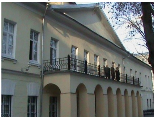
Дом Н.В. Гоголя – мемориальный музей и научная библиотека Никитский бульвар, д. 7а, г. Москва