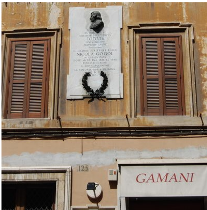
Дом Гоголя в Риме (Италия) на Via Felice

Только в Риме, тихом солнечном Риме находит он успокоение и сходство с милой ему Малороссией: все патриархально здесь, все в стороне от шума Европы, от ее меняющихся прихотей. «Именно здесь, на улочке, которая носит название «Счастливой» – Via Felice – найдет он две комнатки с «ненатопленным теплом», где в равновесии и забытии и завершит свой великий труд» [8, с. 206–207].