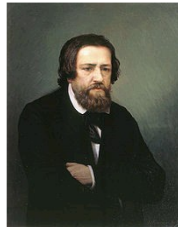
Александр Андреевич Иванов (1086–1858 гг.)

Иванов пишет картину всей своей жизни о явлении Мессии. «Давно задумал и давно пишет, но не видно конца его работе, потому что велика и необъятна тема, – писал И. Золотусский. – Более всего не дается ему фигура Христа на горизонте, он ее пишет и переписывает, и подолгу сидит Гоголь в мастерской художника, глядя на эти муки идеи , которые еще предстоит испытать ему самому» [5, с. 215]. Стремление к непрерывному усовершенствованию своих творений роднит этих гениев кисти и пера. И неслучайно Иванов наделил облик Крестителя чертами Гоголя, своего друга и соотечественника.