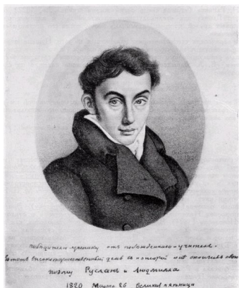
Василий Андреевич Жуковский (1783–1852 гг.)

Рисунок Э. Эстеррейха (1820 г.) с дарственной надписью Пушкину