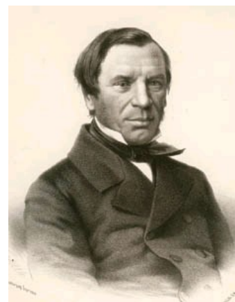
Михаил Петрович Погодин (1800–1875 гг.)

Пушкин погиб вдали от Гоголя, в холодном Петербурге. Гоголь был подавлен, растерян. Он еще не сознавал, какая отныне тяжесть перекладывается на него, и какую тяжесть нес на своих плечах, казалось, так далеко живший Пушкин. «Как будто основа обрушилась, и образовался провал, над которым не на чем было стоять, не на что опереться, – писал исследователь творчества Н.В. Гоголя Игорь Золотусский, – Пушкин был Антей и держал он небесный свод... Теперь под этот свод должен был встать Гоголь» [5, с. 228].