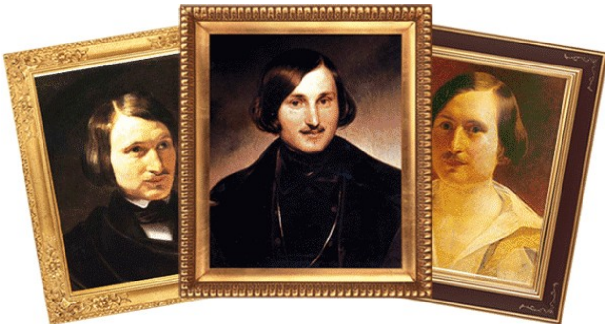
Николай Васильевич Гоголь (1809–1852 гг.). Портреты 1840–1841 гг. работы Ф.А. Моллера

Человечество свято бережет память о самом загадочном из русских классиков, Николае Васильевиче Гоголе. Его творчество всегда притягивало читателей и критиков, ученых и религиозных мыслителей, никого не оставляя равнодушным. Поводом еще раз прикоснуться к имени великого художника стал 200-летний юбилей Н.В. Гоголя, который его почитатели в разных странах отметили первого апреля нынешнего года.