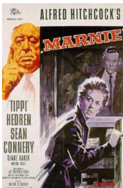
Афиша фильма «Марни»

Помимо «катастрофического непонимания» между Хичкоком и Хедрен, фильм «Марни» доставил режиссеру немало других переживаний. «Вещь пленительная», как отозвался о картине Трюффо, обратила на себя внимание, которое заслуживала, лишь по прошествии значительного времени. Лента оказалась из категории так называемых «великих больных фильмов», то есть шедевром, ослабленным в силу каких-либо ошибок, совершенных в процессе его реализации [2, с. 192]. Причем это понятие, подчеркивал основатель «новой волны», применимо только к произведению очень большого режиссера, уже доказавшего, что в других обстоятельствах он способен создать безупречную картину. Сегодня критики, которые раньше писали разгромные статьи, с тем же энтузиазмом превозносят достоинства этого фильма.