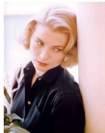
Грейс Келли (1929–1982 гг.)

Келли стала героиней трёх его фильмов: «В случае убийства набирайте «М», «Окно во двор» и «Поймать вора». Хичкок окружил её вниманием, контролировал каждую деталь роли. На съёмках первой картины у Грейс случился роман с женатым актером того же фильма Реем Милландом. Режиссёр ревновал свою Музу, но тщательно это скрывал. Сотрудничество с Хичкоком принесло Грейс мировую славу. Все три картины стали настоящими хитами. Две первых, по результатам опроса Американского Института Кино, вошли в десятку лучших детективных лент всех времен (наряду с его более поздними «Головокружением» и «К северу через северо-запад») [10]. А поцелуй главных героев в «Окне во двор» считается самым соблазнительным в истории кино. Кстати, в том же фильме Хичкок доступными ему средствами «расквитался» с Сэлзником за вмешательство в его режиссуру: он поручил роль убийцы актеру, внешне очень похожему на Сэлзника, и помог тому в точности воспроизвести характерные жесты знаменитого продюсера. Но радость обретения Музы быстро сменилась драмой её потери. Во время съёмок «Поймать вора» Грейс познакомилась с князем Монако Ренье и вышла за него замуж. С тех пор режиссер до конца жизни в каждой новой блондинке искал черты и качества своей любимой актрисы.