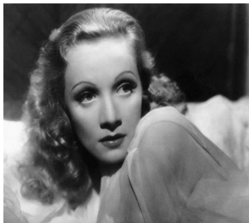
Марлен Дитрих (1901 – 1992 гг.)

Хичкок сделал их всего два. Первым была «Верёвка» – режиссёр дебютировал в ней как продюсер, она стала его первой цветной лентой, первым экспериментальным фильмом, снятым как единый эпизод 3 , наконец, у него впервые сыграл Джеймс Стюарт, вошедший в узкий круг «хичкоковских актеров». В «Верёвке» мастер саспенса решил опробовать входившие в моду «длинные кадры» и подвижной камерой снял фильм сложнейшим методом tmt (ten minutes takes), то есть десятиминутными кусочками, при котором невозможны дубли. Эта лента Хичкока приводится в учебниках по истории кино как единственный пример фильма, целиком основанного на внутрикадровом монтаже. Вторая независимая картина режиссера – «Под знаком Козерога» с Ингрид Бергман провалилась в прокате. Кинокомпанию Transatlantic Pictures пришлось закрыть.