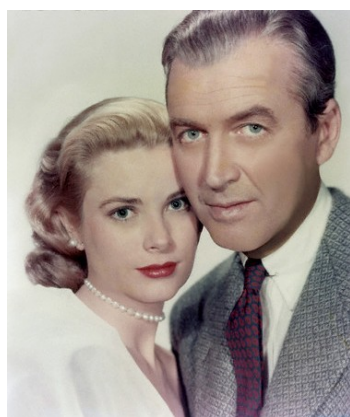
Грейс Келли и Джеймс Стюарт в фильме «Окно во двор»

Годом раньше Хичкок подписал договор с издательством о создании журнала «Тайны Альфреда Хичкока». Эту идею подхватило телевидение, где появилась еженедельная программа «Альфред Хичкок представляет». Его роль в ней сводилась к отбору сюжетов для экранизации, съемке нескольких эпизодов, а также появлению в прологе и эпилоге каждой серии с ироничными комментариями. Музыкальной темой для передачи Хич выбрал отрывок из Похоронного марша марионеток Гуно, который стал классической «хичкоковской темой». За 10 лет из трех с половиной сотен серий, сделанных в жанре детектива и триллера, сам мастер саспенса снял всего около двух десятков. Что не помешало ему получить огромную прибыль от телешоу, ибо программу выпускала его собственная компания.