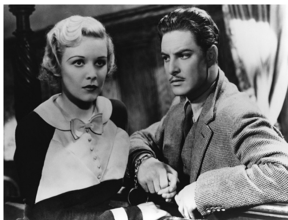
Кадр из фильма «39 шагов». В главных ролях – М. Керолл и Р. Донат.

К 1937 году Альфред Хичкок снял 21 фильм разных жанров: от комедии до мюзикла. Но лучше всего ему удавались триллеры. Картины «39 шагов», «Саботаж» укрепили за ним репутацию мастера с неповторимым стилем. Кроме темы преследования невинного героя, саспенса и «блондинки», в фильмах Хичкока появился так называемый МакГаффин 2 – то, что само по себе не имеет значения, но придает движение всему сюжету, некая очень важная для героев фильма цель, вокруг которой