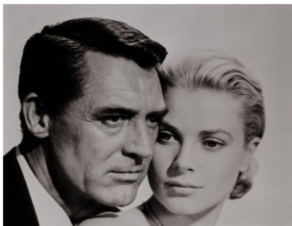
Кэри Грант и Грейс Келли в фильме «Поймать вора»

В ленте «Подозрение» Хичкок встретился с первым из четырех своих любимых актеров – Кэри Грантом. Кстати, его экранный образ настоящего джентльмена – обаятельного рослого красавца со спортивной фигурой, Хич облюбовал для себя в качестве эталона мужской привлекательности. «Когда я ловлю в зеркале своё отражение, – шутил он, – я бываю неприятно удивлен, что там отражается не Кэри Грант» [цит. по: 8]. Хич занял его ещё в трех фильмах: «Дурная слава», «Поймать вора» и «К северу через северо-запад».