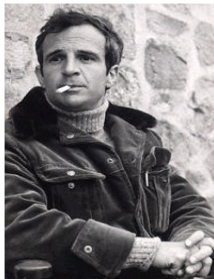
Франсуа Ролан Трюффо (1932–1984 гг.)

В 1978 г. Хичкок взялся за работу над сценарием фильма «Короткая ночь», который решил снимать в Финляндии. Но вскоре понял, что больше никогда уже ничего не поставит. Он пристрастился к водке, приближая свой конец. В марте 1979 года в связи с 80-летием и 55-летием кинематографической деятельности ему вручили награду «За достижения всей жизни» – почётную, но по выражению Ф. Трюффо «попахивающую кладбищем». В ответном слове Хичкок подчеркнул огромную роль супруги в собственной жизни, выразив благодарность четырем своим ближайшим соратникам: «редактору, сценаристу, матери моей дочери Пэт и великолепному повару, имя которым – Альма Ревиль» [13]. В декабре 1979 года английская королева Елизавета II пожаловала режиссеру орден Британской Империи и титул пэра, устранив тем самым ревностное соперничество Хичкока с другим знаменитым уроженцем Лондона – Чарли Чаплиным, раньше него получившим этот титул.