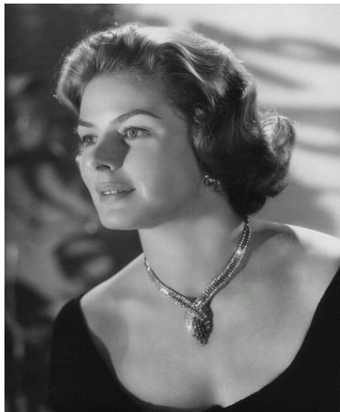
Ингрид Бергман (1915–1982 гг.)

«Завороженный», в котором помимо Бергман снимались Грегори Пек, великий русский актер-эмигрант Михаил Чехов и участвовал художник Сальватор Дали, восторженно приняла критика и публика. Затратив на постановку 1,5 млн. долл., Сэлзник получил 7 млн. прибыли. После Второй мировой войны Хичкок объявил о решении создать со своим другом Бернштейном кинокомпанию Transatlantic Pictures. Чтобы не потерять кассового режиссёра, Сэлзник предложил Фреду определенный процент от сборов следующей картины. Хичкок снял низкобюджетную ленту «Дурная слава» с Ингрид Бергман и Кэри Грантом. Картина имела большой успех и дала возможность режиссёру заняться самостоятельным производством фильмов.