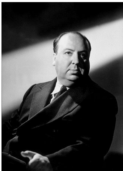
Альфред Хичкок (1899–1980 гг.)

В историю мирового кинематографа знаменитый голливудский режиссер Альфред Хичкок вошел непревзойденным мастером саспенса (suspense). Это английское словечко означает беспокойство. Хичкок, как никто другой, умел своими фильмами создавать в зрительном зале особую атмосферу усиливающегося тревожного ожидания и до конца сеанса удерживать аудиторию в нервном напряжении. «Моя задача – обеспечить публике благодетельный шок, – говорил он. – Цивилизация отняла у нас способность непосредственно реагировать на что бы то ни было. Избавиться от омертвения...можно только с помощью искусственных приемов, действующих на грани шока. Наилучшим образом эта цель достигается с помощью кино» [цит. по: 1]. «Кино, которое делает Хичкок, – отмечал его поклонник, французский режиссер Ф. Грюффо, – до такой степени концентрирует внимание публики на экране, что арабские зрители перестают лущить свои орешки, итальянцы забывают закурить сигарету, французы оказываются не в состоянии заигрывать с соседкой, шведы...и т. д.» [2, с. 7].