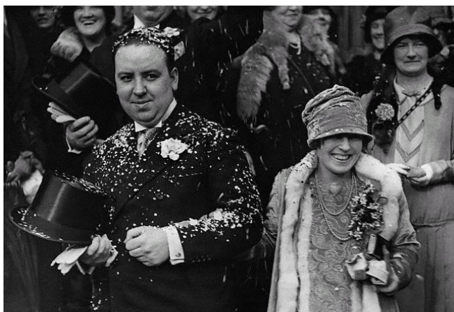
Свадьба Альфреда Хичкока и Альмы Ревиль (2 декабря 1926 года).

Этот брак стал также плодотворным творческим союзом. Альфред и Альма понимали и разделяли взгляды друг друга. Через полтора года у супругов родилась дочь Патриция. Жизнь Фреда всегда определяли женщины: сначала мать, потом жена, а теперь и дочь. Но с актрисами он строил отношения по иным, кинематографическим правилам. Место режиссера позволяло Альфреду иметь такую власть над ними, которая в другой ситуации была бы невозможна. Он контролировал их работу, что давало