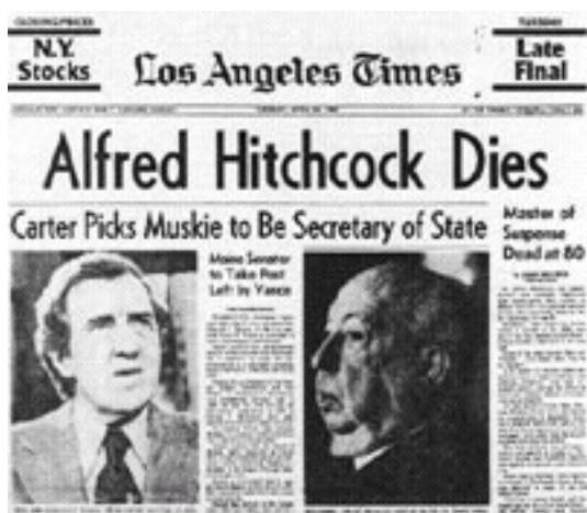
Газета «Лос-Анджелес Таймс», сообщение о смерти А. Хичкока

Обладая визуальным типом мышления, Хичкок ещё до начала съёмок полностью выстраивал свой будущий фильм в голове. Он представлялся ему в виде цепи законченных эпизодов, каждый из которых был чем-то вроде фильма в фильме. Во время работы над картиной режиссёр уже не заглядывал в сценарий, как не заглядывают в партитуру иные великие дирижеры. Он всегда точно знал, когда, что и как должно было сниматься.