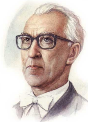
Кабалевский Борис Дмитриевич (1904–1987).

ИСМЕ. Это элегантное слово с легкой руки Д.Б. Кабалевского вошло в советский музыкально-педагогический обиход и в русский язык в 1970 году. Именно тогда в Москве состоялась IX всемирная конференция ISME. А за пару лет до того возникла Советская секция ИСМЕ, которой фактически стал весь Союз композиторов СССР. Союз композиторов был тогда большой авторитетной организацией, объединяющей советских музыкантов, прежде всего композиторов и музыковедов, многие из которых занимались педагогической работой. Советская секция ИСМЕ была активной структурой, по существу выполнявшей в контактах с мировой музыкально-педагогической общественностью писмоводительскую и представительскую функцию. Однако для самой ИСМЕ Советская секция с ее лидером Д.Б. Кабалевским, обладавшим огромным авторитетом, была мощной организацией, способной также профинансировать проведение масштабной всемирной конференции в нашей стране. Кончился Советский Союз. Кончилась и Советская секция ИСМЕ.