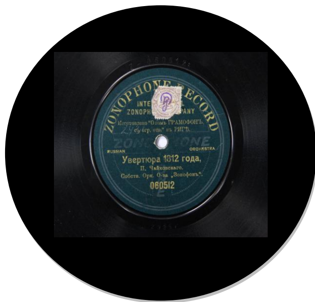
Ил. 3. Грампластинка Увертюра «1812 год»