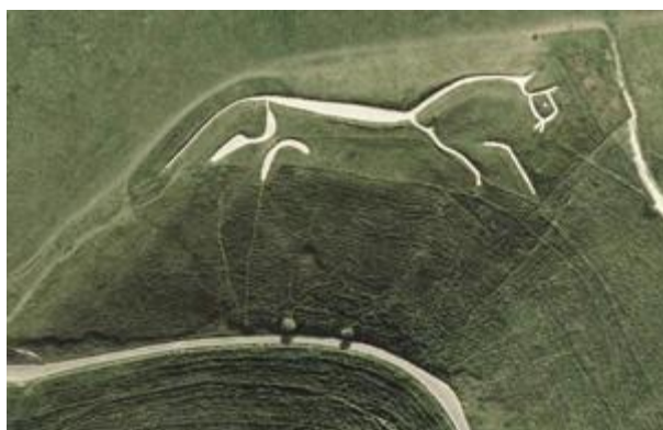
Ил. 5. Уффингтонская белая лошадь. Фото с высоты птичьего полёта

«Сикстинской капеллой первобытной живописи» называют пещеру Ласко , которая находится во Франции в долине реки Везер. Наскальные росписи эпохи позднего палеолита случайно обнаружили осенью 1944 года школьники близлежащего городка Монтиньяк. Стены пещеры покрыты изображениями лошадей, зубров, носорогов, запечатленных с использованием красно-желтого железняка, бурой охры, черного марганца и других красок и обведенных темными контурами.