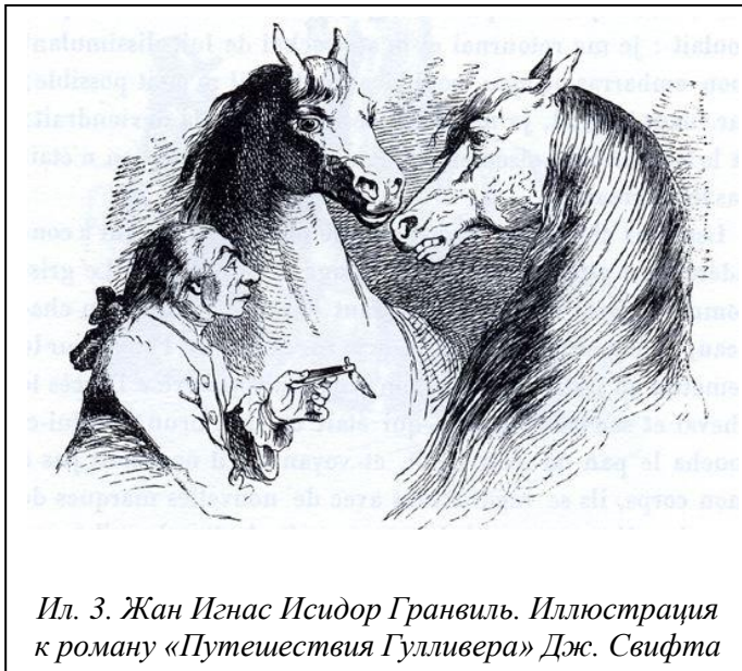
Ил. 3. Жан Игнас Исидор Гранвиль. Иллюстрация к роману «Путешествия Гулливера» Дж. Свифта

Джонатан Свифт , писатель в рясе священника и интересами политика, в четвёртой части прославившего его имя романа «Путешествия Гулливера» вывел лошадей образцами разума, красоты и добродетели. Он перенёс своего героя к гуигнгнмам – похожим на коней вымышленным существам, которые живут в обществе, организованном по образцу человеческого, и обладают даром речи.