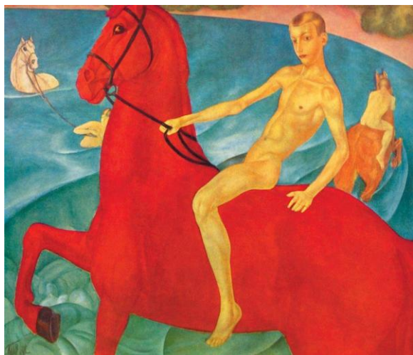
Ил. 8. К.С. Петров-Водкин «Купание красного коня»

колористической гаммой новгородских икон, которая его изумила и восхитила, по примеру древнерусских иконописцев (например, на иконе «Чудо архангела Михаила» конь изображен совершенно красным) изменил цвет на насыщенно алый. В результате на этом полотне, как и на иконах, не наблюдается смешения красок, они контрастны и как бы сталкиваются в противоборстве.