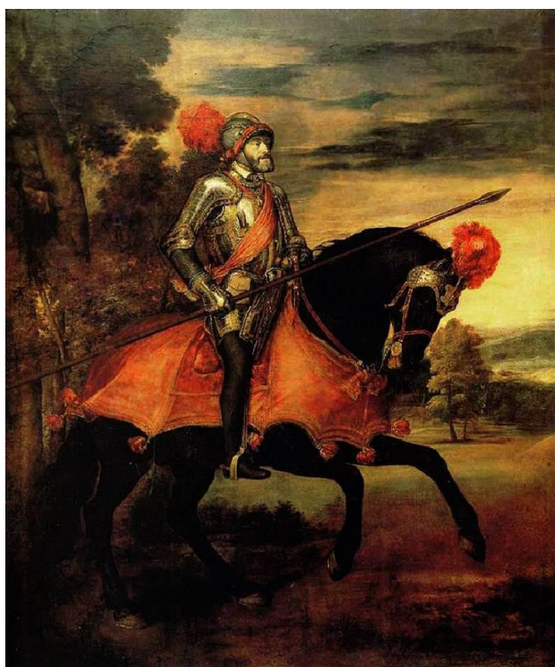
Ил. 7. Тициан. «Конный портрет Карла V»

Героический конный портрет императора «Священной Римской империи» Карла V кисти Тициана (1477–1576), одного из титанов Возрождения, относится к шедеврам мировой живописи.