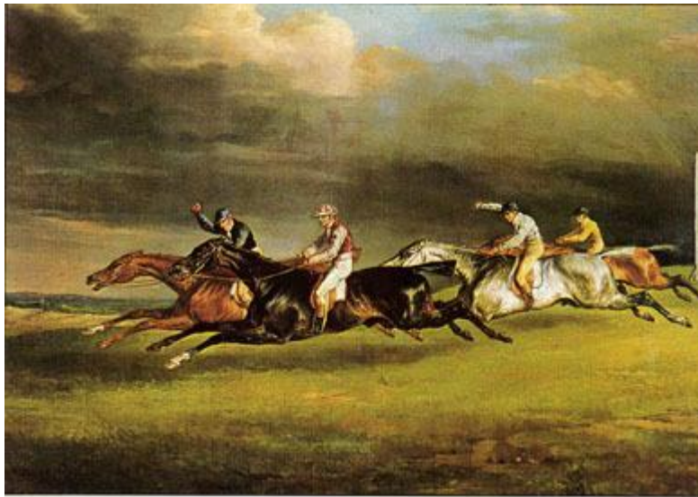
Ил. 8. Теодор Жерико. «Дерби в Эпсеме»

дожника, всё творчество которого уложилось в десять лет. «Какую другую, отличную от этого судьбу обещали, казалось, это изобилие физической силы, этот огонь и воображение... К числу самых больших несчастий, которые только могло понести искусство в нашу эпоху, следует отнести смерть удивительного Жерико», – сетовал его друг — молодой Делакруа, ставший впоследствии лидером французского романтизма [13].