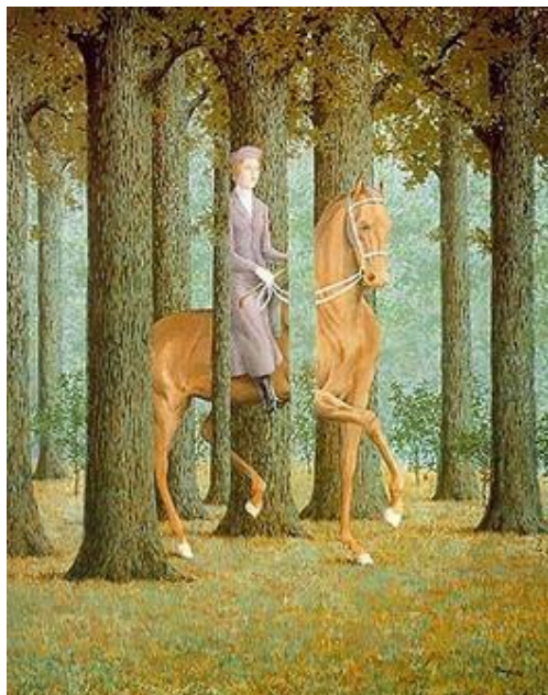
Ил. 11. Рене Магритт «Карт бланш»

Магритт утверждал, что в его композициях, особенно позднего периода, нет ни одной случайной детали, какими бы безумными они ни казались. «Видимые вещи, – пояснял художник, – могут быть невидимыми. Если, к примеру, некие люди едут верхом через лес, то сначала видишь их, потом – не видишь, но знаешь, что они там. В картине «Карт-бланш» наездница заслоняет собой деревья, а они заслоняют ее. Однако сила мышления объемлет и