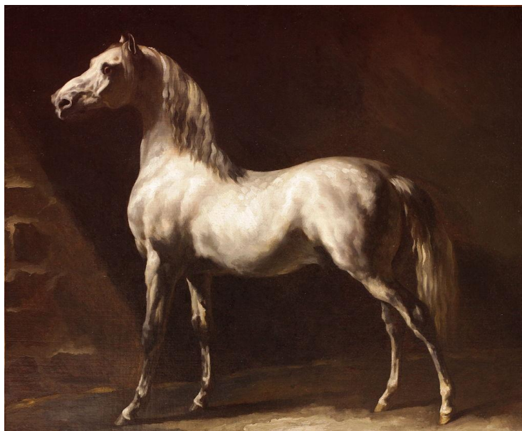
Ил. 1. Теодор Жерико «Серая арабская лошадь»

Лошади – часть духовной культуры человечества. Их красота, ум, благородство, великолепное сочетание силы и грации всегда пленяли людей. Конскую красоту прославляло перо поэта, кисть живописца, резец скульптора. Эти четвероногие создания служили источником вдохновения также в музыке, танце и театре, где они иногда выступали, как та прекрасная белая лошадь с Московского ипподрома, которая выходила на сцену прославленного Большого театра в спектаклях «Дон Кихот», «Иван Сусанин», «Князь Игорь», «Борис Годунов».