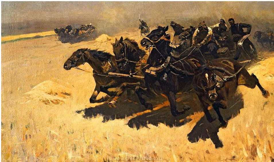
Ил. 10. М.Б. Греков «Тачанка»

Совсем в ином ключе изображал коней Митрофан Борисович Греков (1882–1934), приверженец реалистических традиций русской живописной школы XIX века. Выходец из донских казаков, ученик И.Е. Репина и лучшего специалиста по батальной живописи профессора Ф.А. Рубо, он с 1913 года писал картины на батальные темы истории полков русской гвардии. Во время Гражданской войны Греков одним из первых обратился к её отображению в изобразительном искусстве. С исторической достоверностью и тонким психологизмом он запечатлел боевой путь 1-й Конной армии. Художник виртуозно передавал в своих композициях характер и динамику кавалерийских боёв («Кавалерийская атака», «Зимний поход Первой Конной» и др.). Почти в каждом полотне Грекова присутствуют лошади: различных мастей, во всех их движениях и поворотах, при самом разнообразном освещении. Как никто из его современников он показал коня на войне, своеобразным символом которой стала пронизанная романтическим революционным духом «Тачанка».