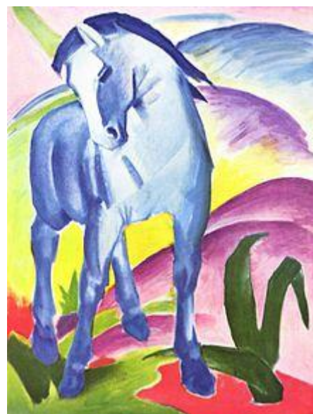
Ил. 9. Франц Марк «Синий конь»

Синих коней писал немецкий экспрессионист Франц Марк (1880–1916), один из главных организаторов объединения «Синий всадник» (Der Blaue Reiter) в Мюнхене, куда входили А. Маке, В. Кандинский, П. Клее и др. Марк считал, что синий цвет передаёт гармонию и ритм природы, с которой он отождествлял всё прекрасное. Художник развивал в своём творчестве направление анималистического экспрессионизма («Синий конь», «Башня синих коней»). Марк пытался увидеть мир глазами животных. Он писал в дневнике: «Как скудна и бездушна наша традиция: помещать животных в ландшафт, видимый нами, вместо того чтобы проникнуть в душу животного и понять его видение» [21].