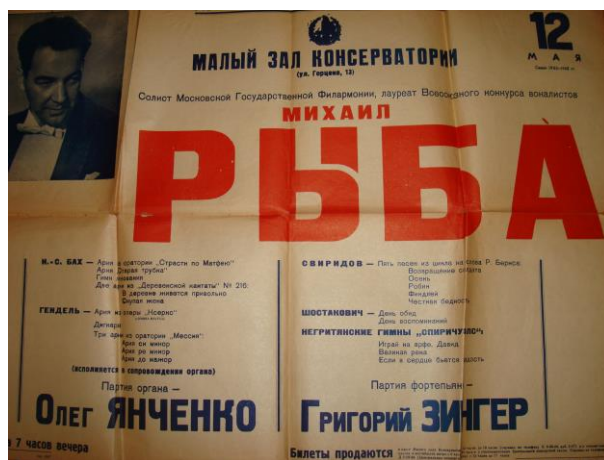
Ил.6. Афиша solo-концерта 12 мая 1963 года в Малом зале Московской консерватории