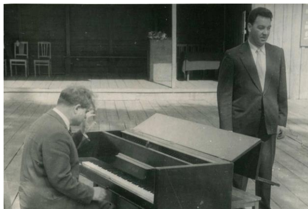
Ил. 10. На одном из концертов в городе Елец. Певцу аккомпанирует композитор Тихон Хренников