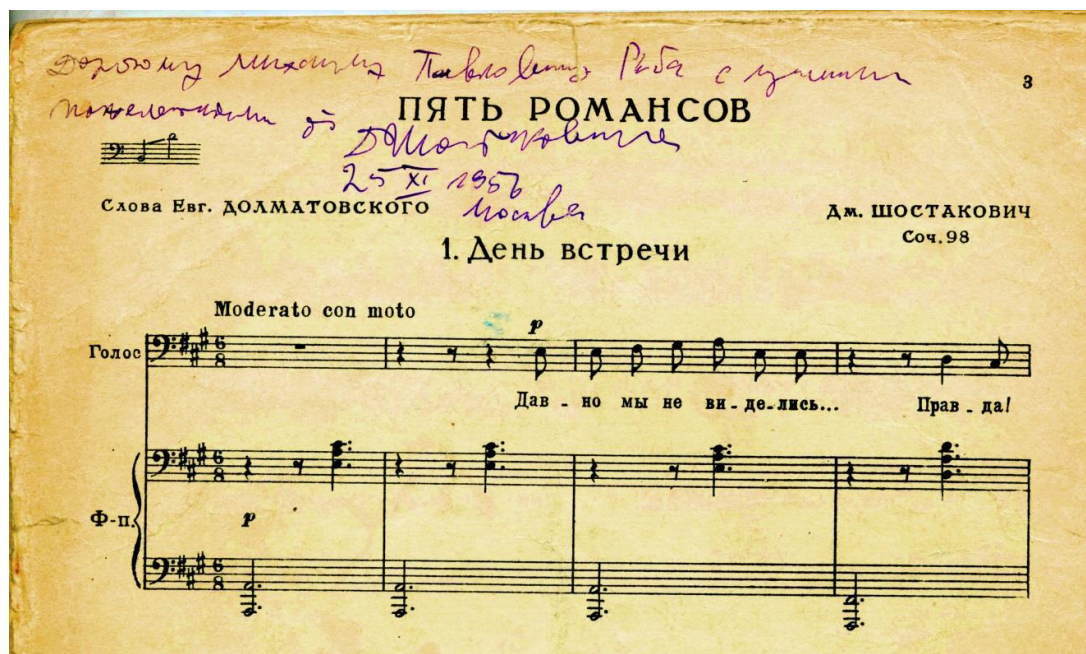
Ил. 5. Ноты «Пяти романсов на стихи Евгения Долматовского» с автографом Д.Д. Шостаковича

него. В труднейших, наполненных колоратурами партиях, исполняемых М. Рыбá, все точно и идеально выпевалось. Техническое совершенство всегда было подчинено музыкальной выразительности, точному проникновению в замысел исполняемых произведений.