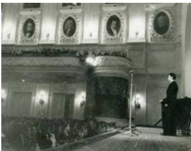
Ил. 3. Концерт в БЗК. Выпуск 1948 года