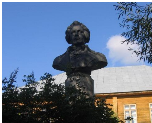
Ил. 3. Бюст А.Т. Болотову в д. Дворяниново Тульской области

Но в то же время Андрей Тимофеевич старался использовать и придуманные им новые для садово-паркового искусства подходы. Он использовал местные породы деревьев и кустарников, разработал оригинальную систему водоснабжения. В его парке были многочисленные пещеры, павильоны,