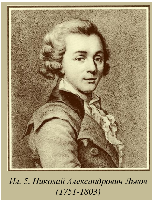
Ил. 5. Николай Александрович Львов (1751-1803)

Был такой замечательный человек Николай Александрович Львов – просветитель, художник, архитектор, инженер, фольклорист, живший в конце XVIII века. Он жил в Петербурге, а усадьба его была в Тверской области: Никольское-Черенчицы под Торжком. Будучи человеком отзывчивым, он построил для своих многочисленных родственников массу новых домов, дворцов, церквей, мостов. И вот я приехал в Торжок, потом был в Валдае, потом поехал в его усадьбу и всюду находил следы деятельности Николая Александровича. У него была совершенно замечательная усадьба с мавзолеем, погребом-пирамидой, кузницей в виде моста из валунов... К