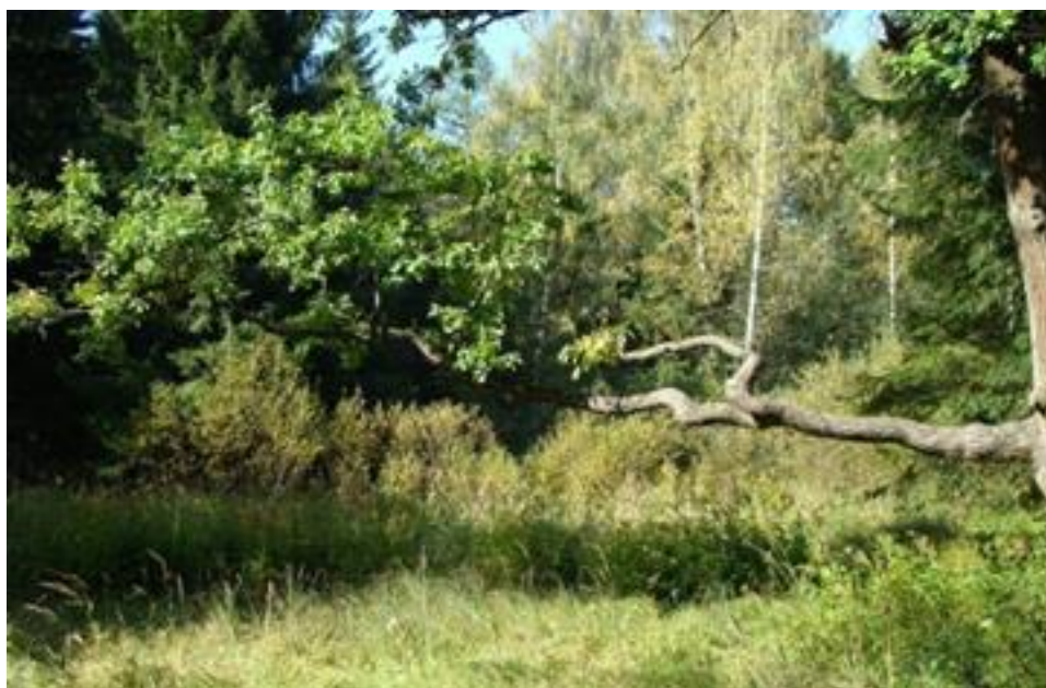
Ил. 2. Баболовский парк, г. Пушкин (Царское Село)

Решение турецких властей вырубить небольшой, напоминающий сквер, парк Гези в районе Таксим в Стамбуле и построить на его месте торгово-развлекательный комплекс стало поводом для массовых выступлений с требованием отставки правительства. Что происходит с историческими парками и садами? Какие здесь проблемы?