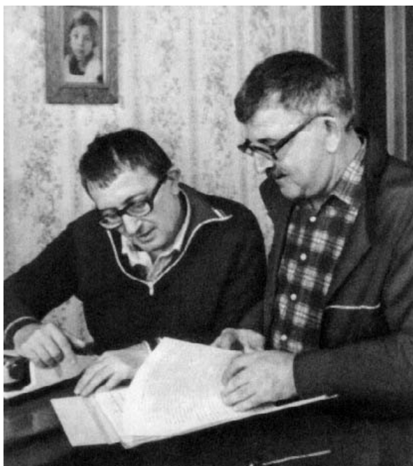
Ил. 1. Аркадий Натанович (1925—1991) и Борис Натанович (г.р. 1933) Стругацкие

(«каммереровский» цикл в качестве системы проектирования этического гуманизма)